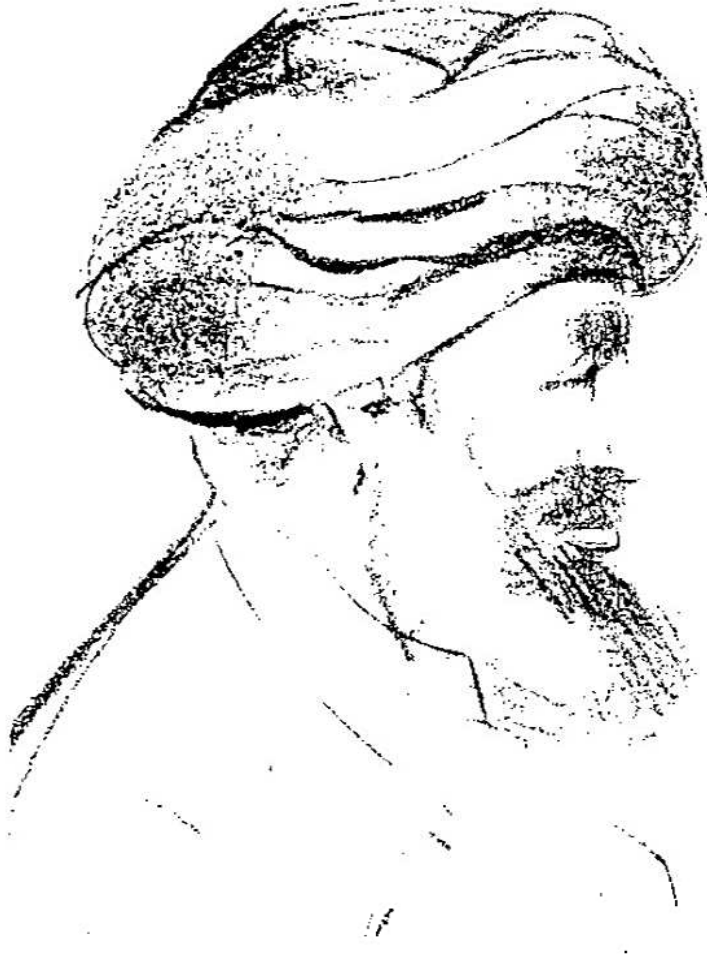
شكل رقم (١)

ديسيه . وقد هنأه القائد الفرنسي على حسن بلائه وقدم إليه سيفاً تذكاريًا نقشت عليه « معركة عين القوصية - ٢٤ ديسمبر ١٧٩٨ » . وفي هذا الوقت كانت حدة القتال في الصعيد قد هدأت ، وساعدت الطبيعة الجغرافية للصعيد من احتوى به من المماليك على أن يجدوا ملاذاً آمناً في كفوره ونجوعه القابعة في بطون الجبل ، كما عاق ضيق الوادي المطررد نحو الجنوب أى تقدم فعال للقوات الفرنسية الزاحفة التي اكتفت بإقامة نقاط عسكرية فيما احتلت من أقاليم . ومن ثم طالت حملة الصعيد أكثر مما كان متوقعاً .